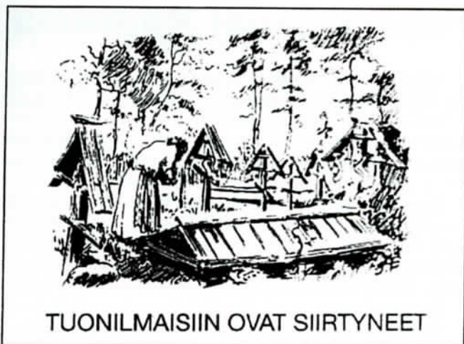
TUONILMAISIIN OVAT SIIRTYNEET