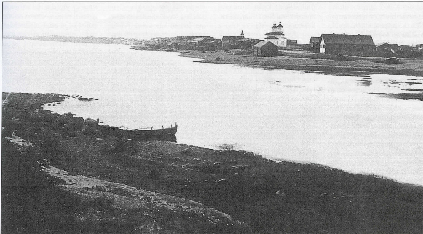
Vanhaa Uhtuaa joen ja Kuittijärven puolelta. Etualalla kirkko ja siitä vasemmalla näkyy tsasunan torni, taempana ovat Ryhjä ja Likopää.

Onneksi meillä on mahdollisuus nähdäkin. I.K. In-