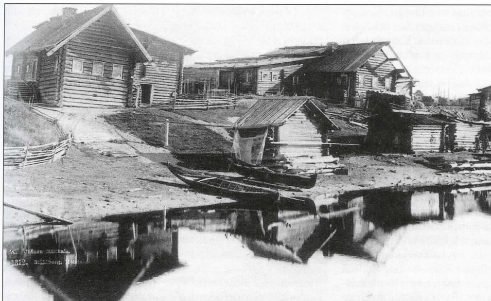
Inhan usein nähty klassikko: Miitkalan talot peilautuvat Uhtujen pintaan.