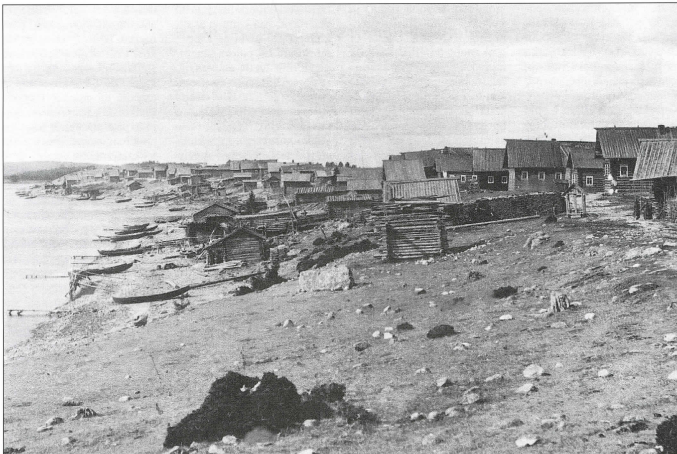
Likopään kylänosa kaartuu pitkin Keski-Kuittijärven rantaa, talot termällä, kylät ja venevajat alempana rannassa.