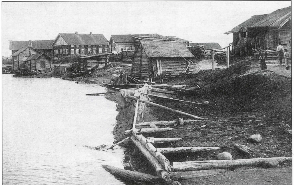
Jokinäkymä Lamminpään kyläosasta sillan alapuolelta.