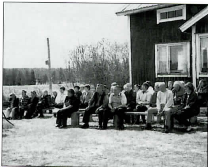
Toukosiunausjuhla Hyrynsalmella kesäkuussa.