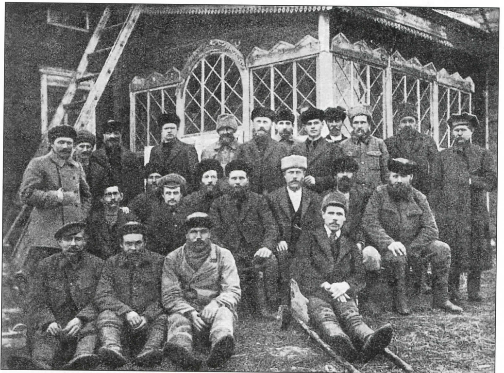
Vuokkiniemen kunnan edustajat Uhtuan maakuntapäivillä maaliskuussa 1920. Kuva on suvun perimätiedon mukaan otettu Ondronon talon kuistilla.