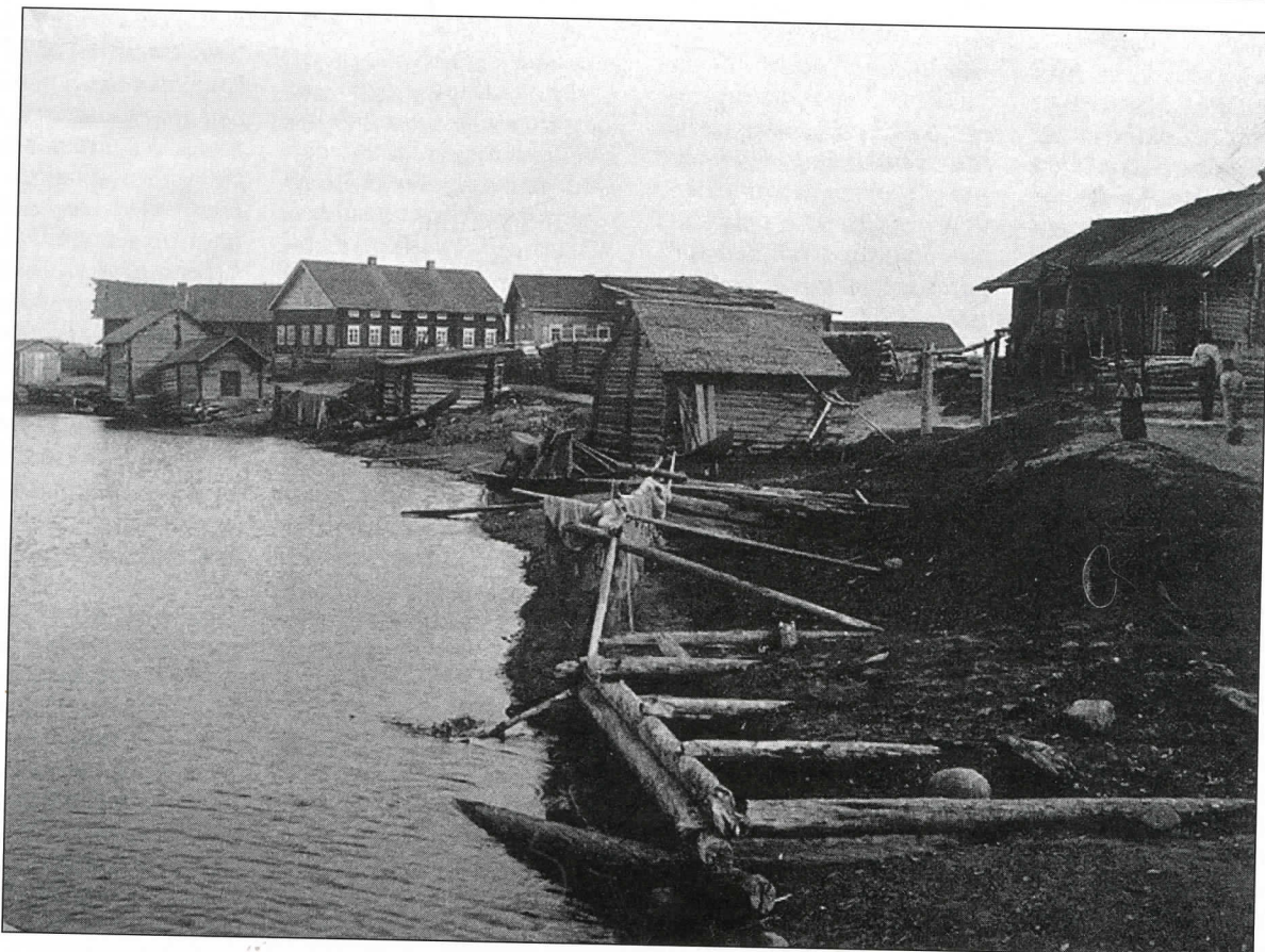
I.K. Inhan kuuluisa kuva Uhtuan Lamminpohjasta. Taustalla näkyvän ”suomenmallisen” talon takana lienee ollut ”venäjänmallinen” Ondrono.