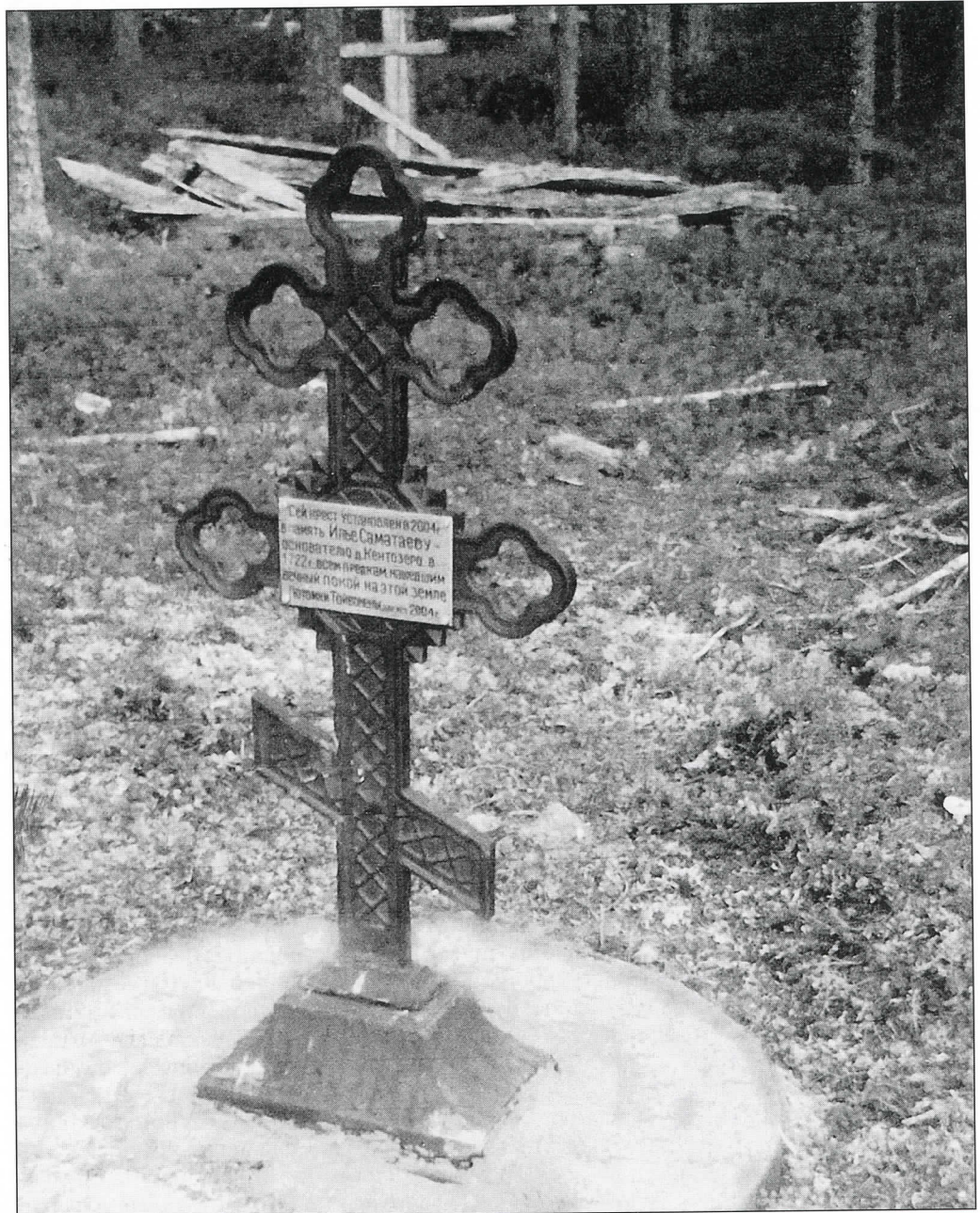
Autoituneen Kenttijärven kylän entisten eläjien muistoristi seisoo vankalla perustalla.