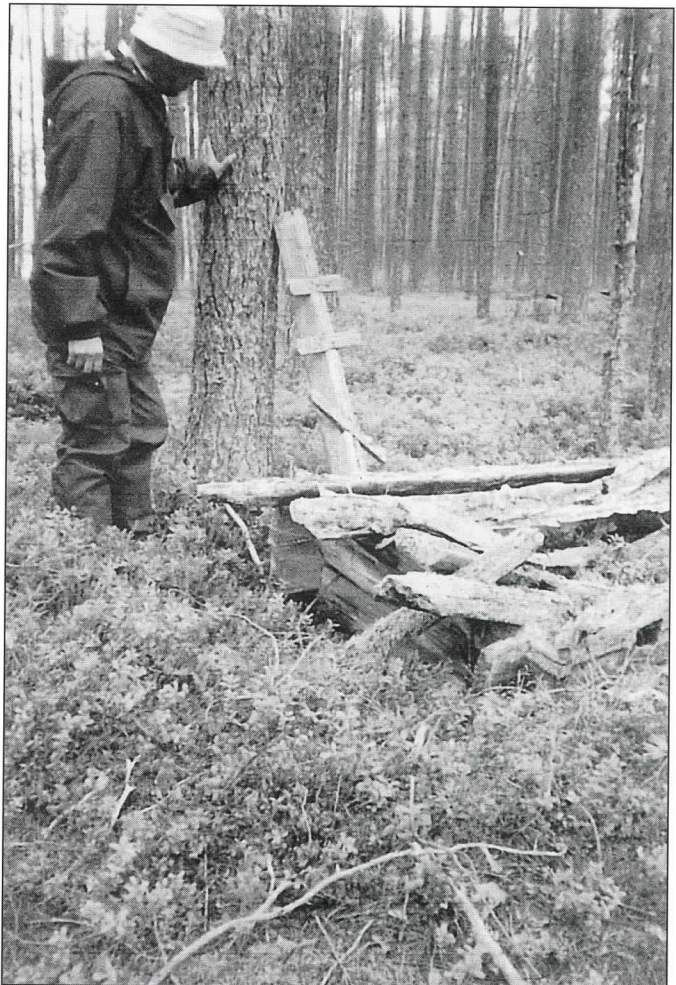
Aika on tehnyt tehtävänsä vanhalla kalmismaalla.