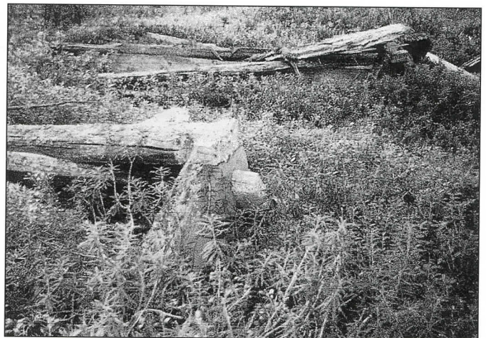
Harmaantuneet risti ja kropnitsat.

Sillä aikaa betoniperusta oli saanut kahdentoista tunnin jälkeen valamisesta riittävän lujituksen ristin asettamista varten. Lähtiessämme veneellä kalmismualle päätimme ensin poiketa Ossipan talonpaikalla Toivahanniemessä. Otimme sieltä