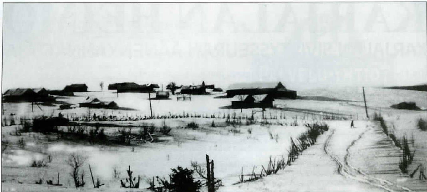
Kivijärven kylä talvisessa asussaan (valokuva on sota-ajalta).