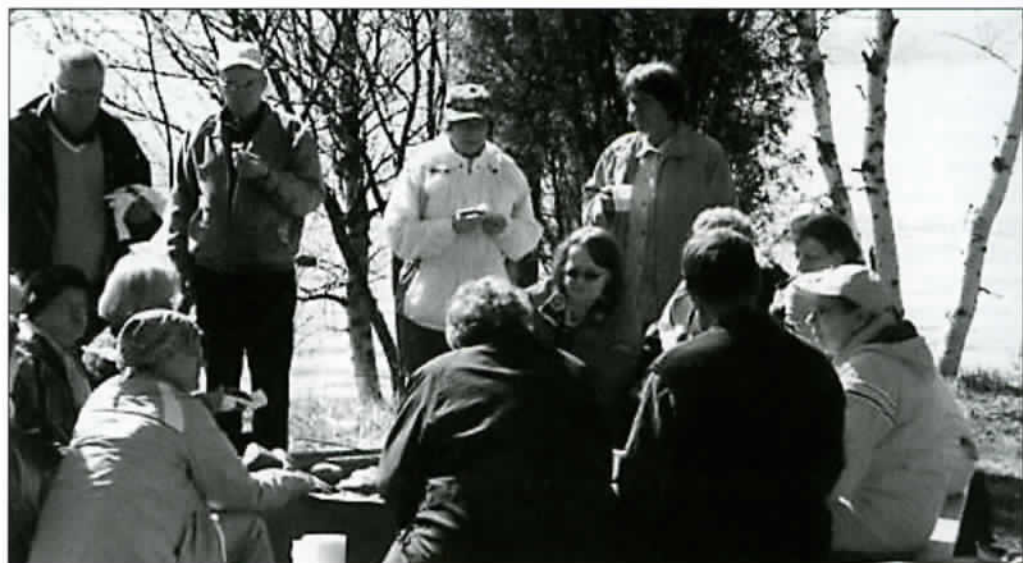
Pohjois-Viena-seuran väki vaihtoi vilkkaan kevään kuulumisia toukokuussa Iijoen rannassa. Ilma oli aurinkoinen ja jokimaisema kaunis.