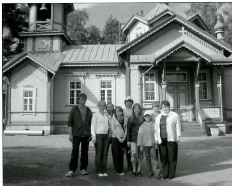
Karjalan, vepsän ja suomen kielikilpailuissa menestyneet petroskoilaislapset tutustuivat palkintomatallaan kesäkuussa Joensuuhun. Yksi kohde oli Joensuun ortodoksinen kirkko.