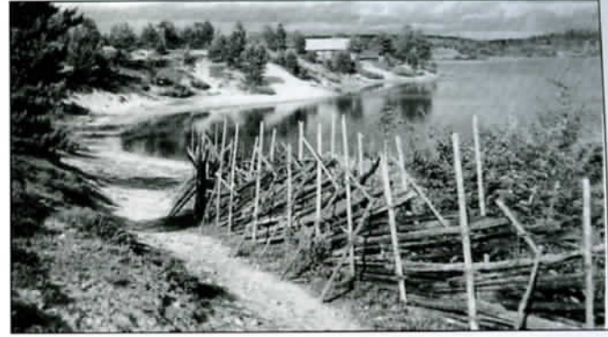
Pirttilahden maisemia sotavuosilta. Kuva otettu kylän keskustasta Maksimanniemeen päin. Vasemmalla isompien lasten suosima uimapaikka Hypintermä, jossa oli nähty Vetehinen...

– Minua suositeltiin emäntäkouluun Hiilisuole, jossa suomalaisopettajat opettivat meille paljon maatalouden perusasioita. Suomalaisopetus oli muutenkin paljon laadukkaampaa kuin venäläisaikana.