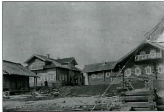
Karjalaisen talon pihapiirissä on useita rakennuksia neulion muodossa.

Jos hyvät toivomuksemme toteutuisivat, niin luultavasti löytyisi meissä karjalaisissa sellaisiakin ihmisiä, jotka ovat oppineet tovereilta kaikenlaista kelvotonta viisautta, ja kävisivät väittämään, että meidän maat on ostettu epärehellisellä tavalla, hämäräkaupalla oppimattomalta kansalta. Ja kun ei ole, millä todistaa, että toverit ovat kaikki