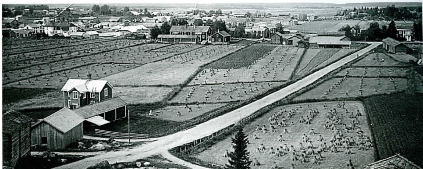
Maisemaa Vöyrieltä menneinä vuosikymmeninä.