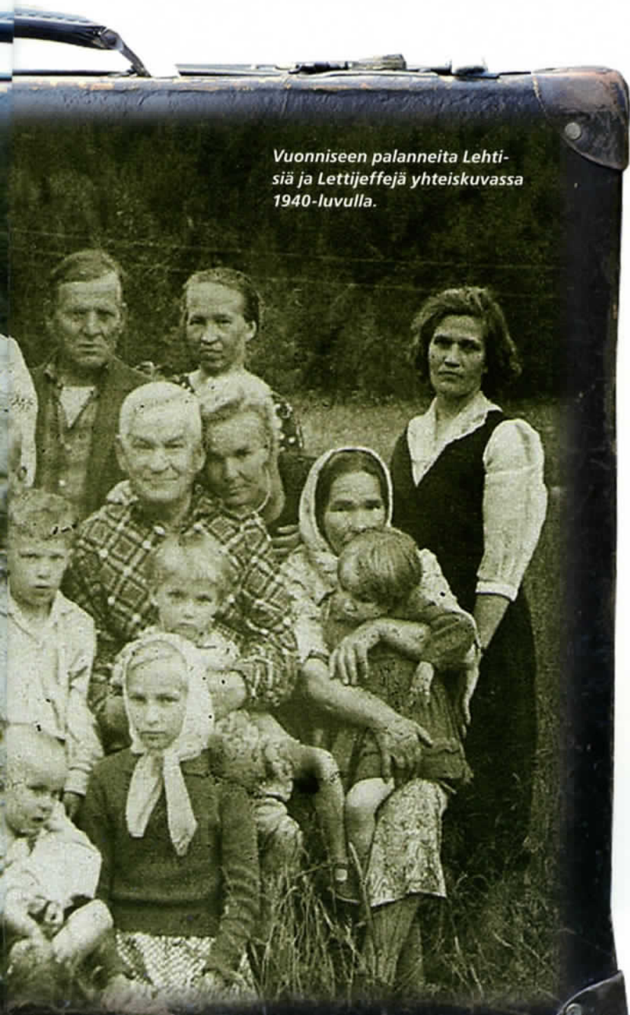
Vuonniseen palanneita Lehtisiä ja Lettijeffejä yhteiskuvassa 1940-luvulla.

"Kymmenkunta uteliasta naamaa oli litistynyt pirtin pieniä ruutuja vasten katsomaan, mikä hiidenhiippa se pihaalle oli porhaltanut ja siinä päästeli petraansa [= poroa] helisevistä valjaisista. Kiipesin ylös pirttiin ja tekasin hyvät päivät. Mutta oitis kummeksuin, ettei vuonnislainenkaan väki ottanut tehdäkseen kirkasta karjalaista vaikutelmaa. Hiisikö mokoman jättäjästaipaleen taakse vienalaiset veret oli sekoittanut? Romanan talossa oli kaksikin emäntää, jotka molemmat olivat syntyisin - Vaasan läänistä. Poikaparvessa tosin porahteli karjalaisleppä, mahdollisesti höysteenä pisarainen 'härmäläistä'. Päätän viime mainitun ilmeen siitä, että yksi pojista minulle jutteli Vuonniskylän 'suuta-asi-oista', viinan ryöstöistä, starssinan haukkumisista, miravoi-sutjasta, porovarkauksista ja poikajoukon yövellakoista,