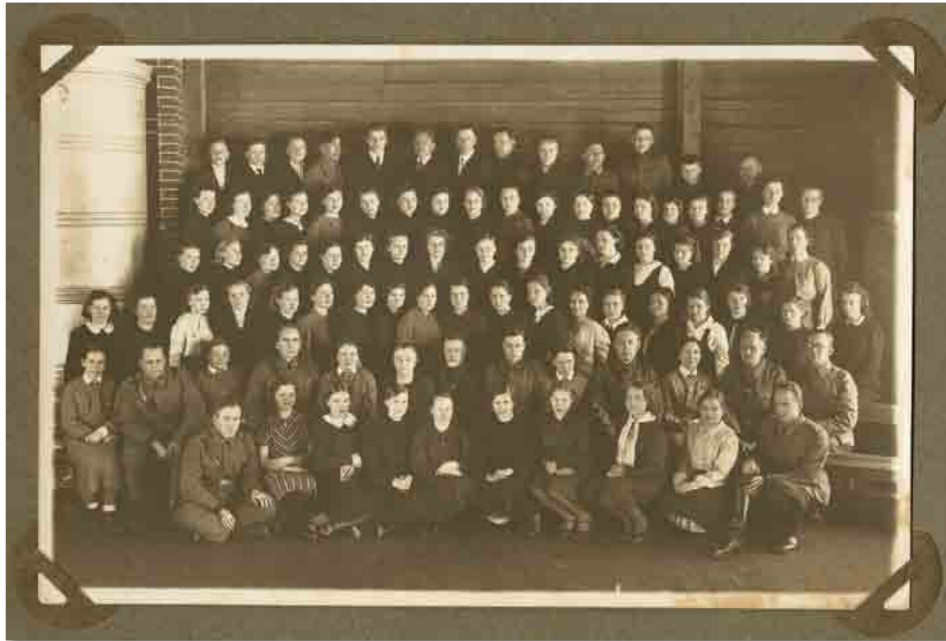
Mieslahden opettajaleirin opettajat ja oppilaat keväällä 1942.

Mieslahdessa esiintyi jonkinlaista poliittista liikehdintää. Vallankumousjohtaja Leninin kuolinpäivän (21.1.) vietosta kehittyi poliittinen mielenilmaus, kun suuri joukko naiskurssilaisista tuli aamiaiselle mustiin pukeutuneena. Leirin johto piti pukeutumista mielenilmauksena Suomea ja leiriä vastaan. Leirin päällikön nuhtelun jälkeen neljä naista tuli tunnustamaan taivutelleensa muita kurs-