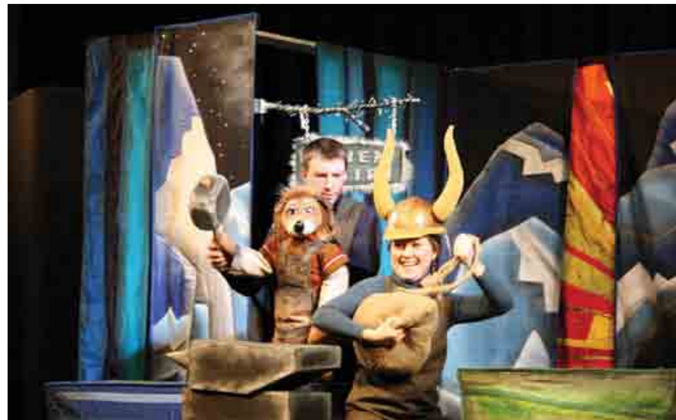
Maanantaina 2. huhtikuuta Rahvahallini karjalankielini Čičiliušku-kuklateatteri sai Koirien Kalevala -näytelmänsä ensi-iltaan. Petroskoin kansallisen teatterin, kumpasessa pöjettih näytelmän, tuli 300 henkilyö. Ensi-ilta tuli karjalan kielellä omissetuksi puasniekaksi.

Vuoden 2012 kulttuurifoorumiin ovat suomalaiset tehneet hanke-ehdotuksia venäläisille toimijoille alkuvuodesta. Venäläiset partnerit vastaavat suomalaisten hanke-ehdotuksiin 15.5.2012 mennessä.