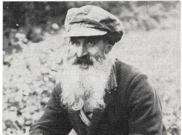
Kyminlinnan yksi starikoista — Pitkäniemi?

Tähä tapah kirjottau tiedemies kantelehesta: Suomalaisessa balalaikassa on liian monta kieltä ja tämän takie sen viriessä pitämini on hankala. Soittajalla pitäy olla aina käsillä jakoavain, kun usiettsi pitäy kielie kiristyä kesen soittamisen, sillä jos toisen laijan kielele on suanut niin tiukalla, kun pitäy, niin toisella laijalla olovat kielet on jo ennätetty löystyö. Masentava näky kohtuau Kalevalan tuntijan suomenkielestä Kalevalua kattsuossah, heti ensimmäisellä lehellä, mihi painettu valokuva esittä kalevalaisen kansan kunnianarvoisinta miestä, Väinämöstä soittamassa tämmösellä varrettomalla balalaikalla.