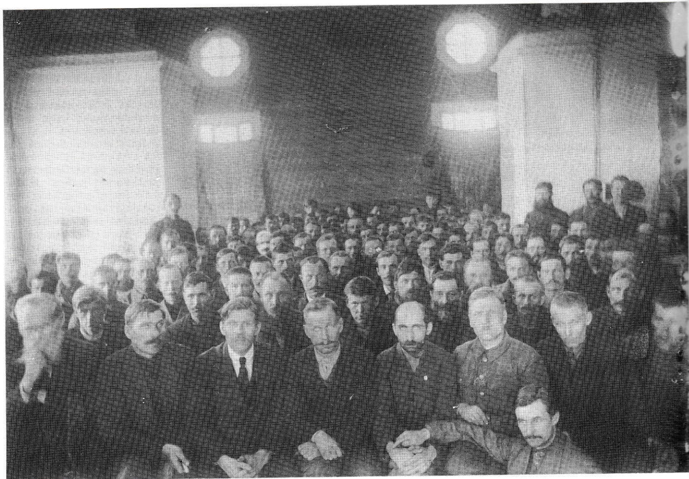
Harvinainen, historiallinen valokuva Uhtuan maakuntapäiviltä keväällä 1920.

Näiden muistelmien tarkoituksena ei ole yksityiskohtaisesti selostaa asiain käsittelyä ja maakuntapäivien päätöksiä, sillä niistä kertovat kokouksessa tehdyt pöytäkirjat. Tähän on kirjoittaja ottanut etupäässä ne kohdat, mitkä eivät aina ilmene pöytäkirjasta ja ikäänkuin täydentävät tuota virallista puolta. — I osa julkaistiin Karjalan Heimon numerossa 3—4.