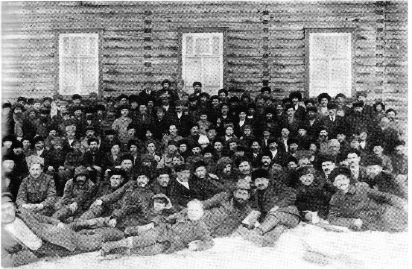
Uhtuan maakuntapäivien osanottajat ryhmäkuvassa seminaarin seinustalla.