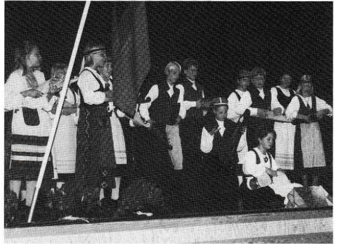
Lapsiryhmä Vesselin esitys kantelen synnystä oli yksi heimojuhlan mainioista ohjelmanumeroista.