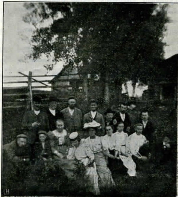
Eräs kesäinen matkue, menossa Vienan Karjalaan.

Aina pakanuuden päivistä pitäin, halki historiamme valaisemain vuosisatojen on tuo Pohjanlahden ja Vienanmeren välinen taipale, joka hartioillaan kantaa Skandinaavian ja Turjanmaan saarentoa, ollut luonnollisena lakkaamatta koskiveneitä kuljettavana kauppaticinä mainittujen Idän ja Lännän valtameristä toisiaan tavoittelevain lahdelmain välillä.