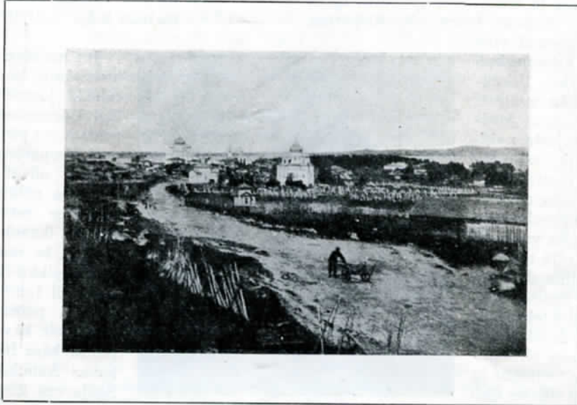
Petroskoi, Aunuksen ja Neuvosto-Karjalan pääkaupunki. (Kuva entisajoilta)