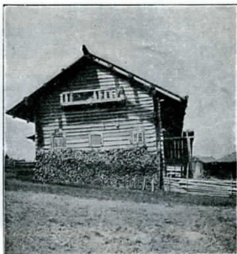
Vornasten vanha sukupirtti Korpiselän Tolvajärvellä.

Kiitos sinulle metsän kuningas, metsän kultainen kuningas, metsän mieluisa emäntä, metsän ihana impi, metsän onni, metsän suosikki, metsän valkea, kannis vasikka, metsän koko valtajakunta.