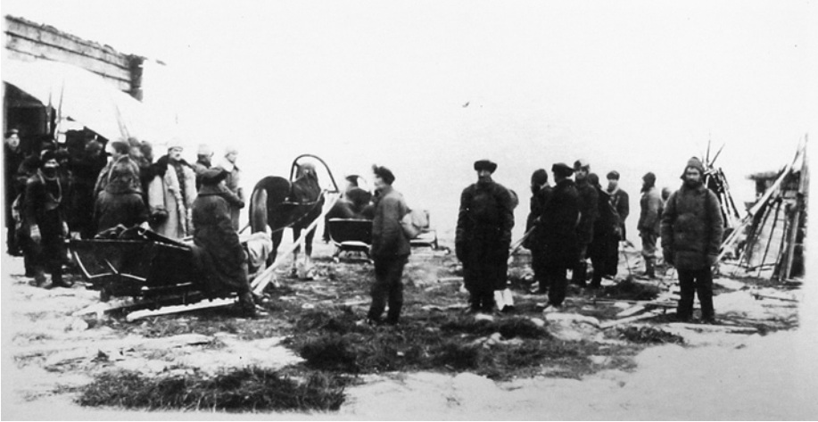
Lähtö Tiirosta 16.2.1922.

rajan yli. Miehillä jätettiin vain huonoja tai käyttökelvottomia kiväärejä ja mitätön määrä ammuksia. Suomen raja saavutettiin yhdeltä iltapäivällä ja Kurvisenvaaran kenttävartiosto, kuten oli odotettukin, riisui karjalaiset aseista. Bolshevikit eivät uskoneet karjalaisten oikeasti lähteneen. Vielä seuraavana päivänä Tiiraa ammuttiin tykeillä ja vasta kolmantena päivänä Vienan Rykmentin poistumisen jälkeen bolshevikit miehittivät kylän. 40