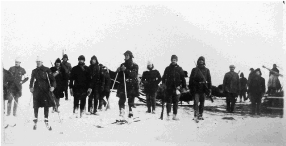
Tiiron taistelun lomassa 14.2.1922.