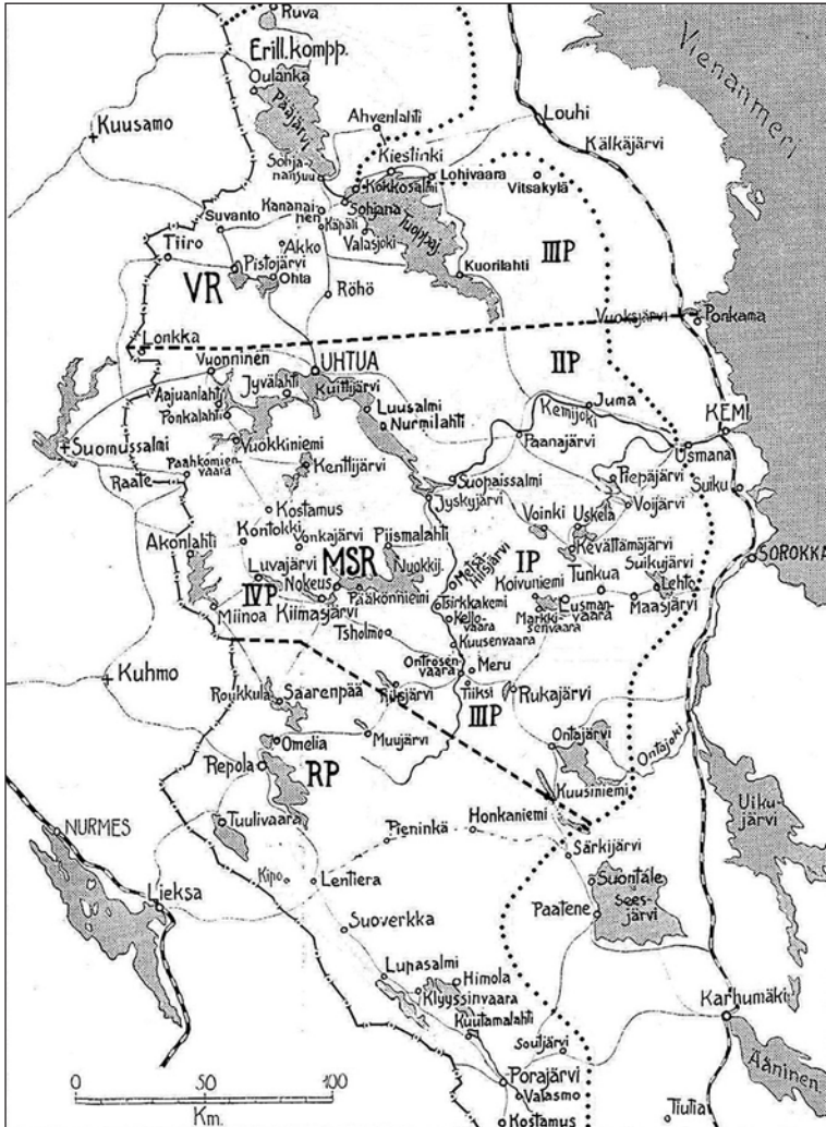
Itä-Karjalan kansannousun vaikutusalue sekä joukko-osastojen toiminta-alueet. Ero Kuussaari: Vapaustaistelujen tiellä. Loviisan Uusi Kirjapaino OY Loviisa 1957, 191 julkaistua karttaa KA:n arkistolähteiden, muun muassa Väinö Heikkisen Pohjois-Vienan kartan (Karjalan kansannousun arkisto 13) pohjalta täydentäen muokannut S. Kallio.