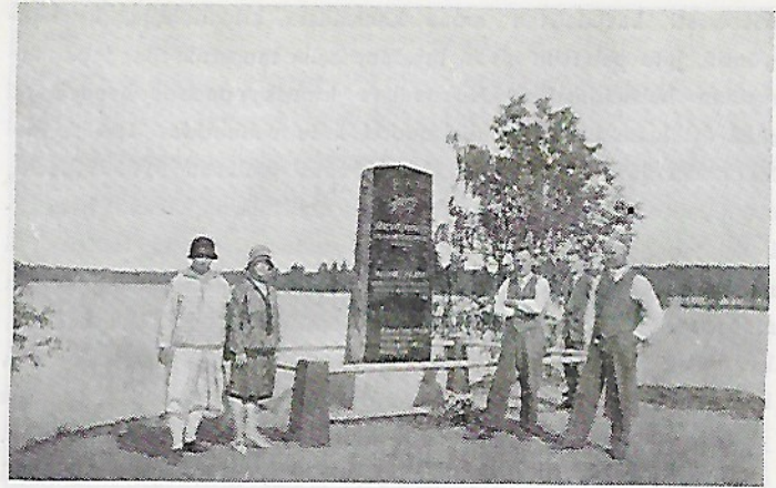
Patsas valmiina: Pystyttäjät pystyttämisen ja raivaustyön jälkeen.