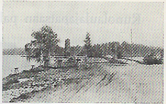
Patsas istumapenkkeineen kivisillalle päin.