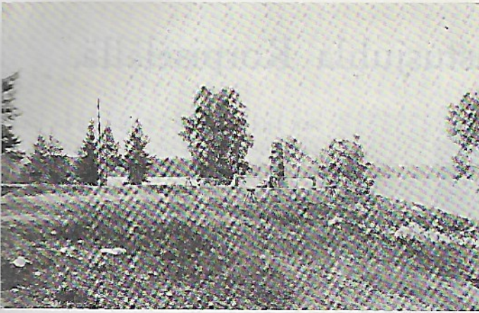
Tolvajärven patsas sillasta päin nähtynä.