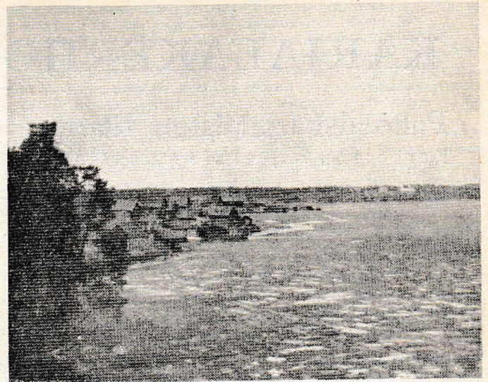
MAISEMIA POHJOIS- JA KESKI-AUNUKSESTA Repolan—Rukajärven saloilta. Prääshänkylä ja- järvi.

vielä ryöstämään teidän lapsennekin. Olemmeko me porvareita, joilla ei ole syötävää ja varoja puoleksi vuodeksikaan? Me olemme tehneet työtä neljätoista tuntia vuorokaudessa, mutta nuo — mitä työtä he ovat tehneet tai tahtovat tehdä?