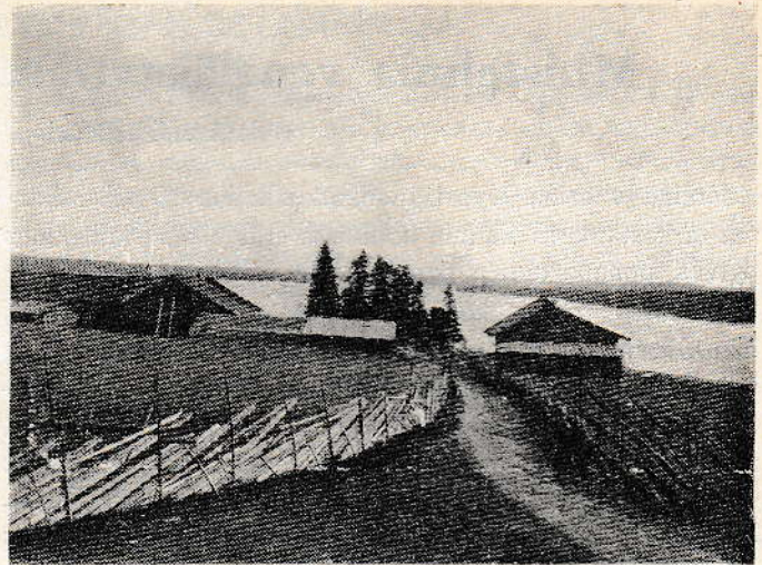
Rantakuva Luovutsaaresta