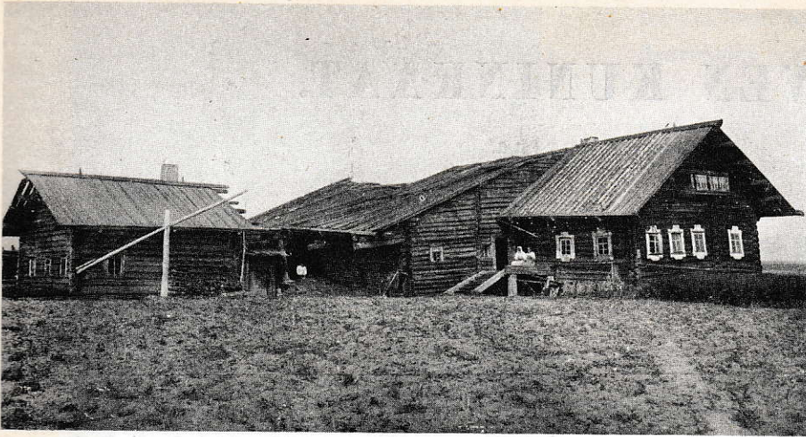
Kaunis karjalainen talorykelmä vanhaa tyyliä. (Repolan Tsolkasta.)

Slykypäivien karjalaisia ja karjalattaria sekä vanhaa karjalaista rakennustyyliä.