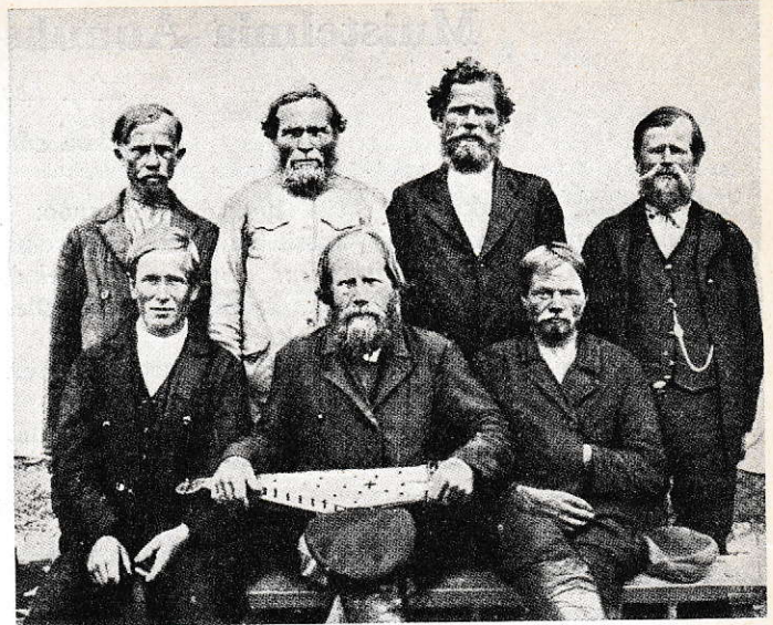
Kolatselän ukkoja Tulemajärveltä Keski-Aunuksessa.