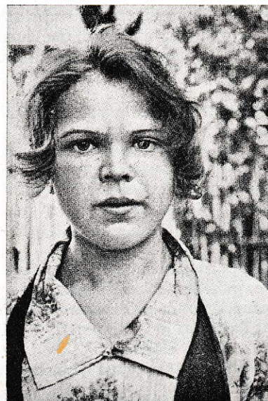
Karjalatar Pyhäjärveltä Keski-Aunuksessa.