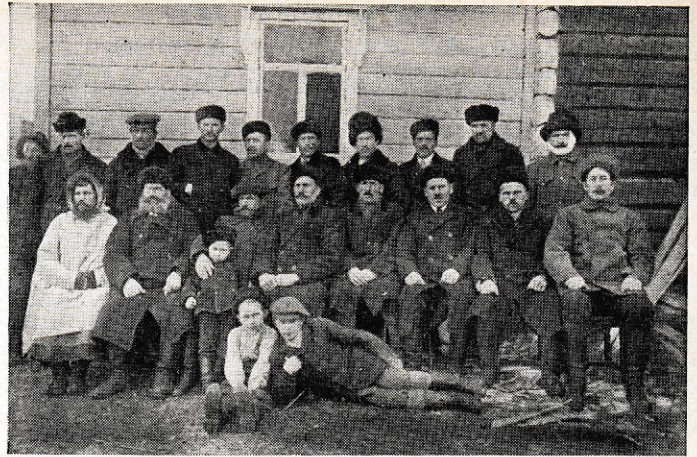
Kiestingin ja osaksi Pistojärven kuntain edustajia Vienan Karjalan maakuntapäivillä Uhtualla ja Vuokkiniemellä, kesällä 1920.

Muistakaa lahjoituksilla ja jälkisäädöksillä Karjalan Sivistysseuran rahastoja!