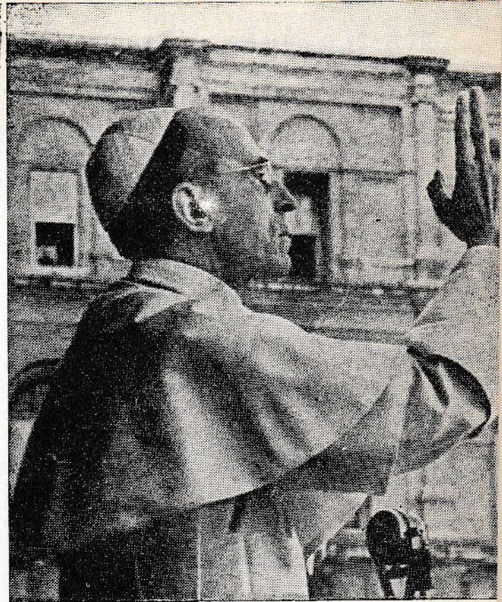
Paavi Pius XII piti jokin aika sitten puheen 20 000 italialaiselle. Puheessaan paavi tuomitsi bolševismia. Paavi on suhtautunut maamme hyvin myönteisesti.

Mutta kun tämäkään laki ei ollut vielä riittävä tarkistetun uudistuksen aikaansaamiseksi, annettiin vielä uusi lakialoite asiasta valtakunnanduimalle. Seuraavana vuonna se hyväksyttiin ja astui voimaan toukokuun 29. p:nä 1911. Tämä maareformilaki, joka oli edellisiä kaikin puolin parempi, soi yksityiselle talonpojalle täydellisen vapauden erota ja erottaa maaosuutensa kyläyhteisön yhteydestä milloin tahansa. Ei enää tarvinnut erolupaa pyytää kyläyhteisöltä ollenkaan, vaan tuli ainoastaan tehdä kirjallinen ilmoitus asiasta kihlakunnan maanjakokommissionille, jolloin asia joutui ilman muuta ratkaisuun. Sanottu komissioni määräsi heti jonkun asianomaisista jäsenistään