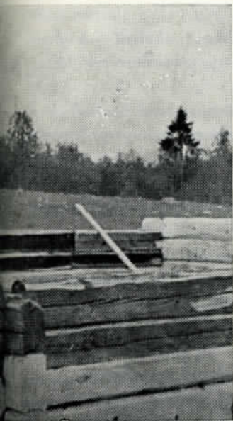
soaa polletun tilalle.