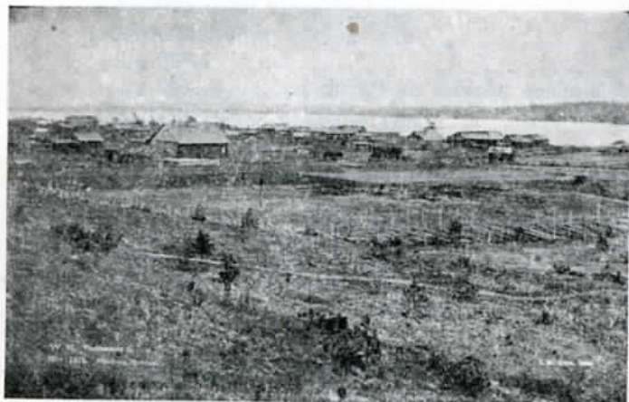
Vuokkiniemen kirkonkylää. Kuvassa lähinnä Keynään syntymäkoti.