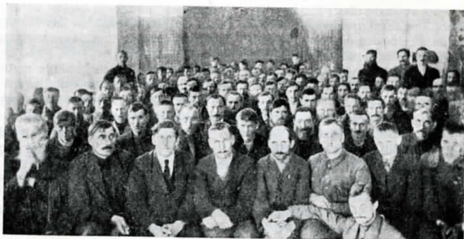
Vienan Karjalan I maakuntapäivien edustajat Uhtualla 21. 3.—1. 4. 1920.