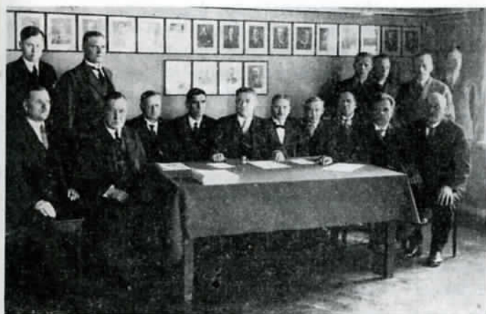
Karjalan Sivistysseuran 25-vuotisjuhlakokouksen osanottajia seuran huoneistossa Helsingissä.