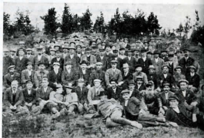
Vienan Karjalan II maakuntapäivien osanottajat Vuokkiniemellä kesäk. 11.—14. pñä 1920.