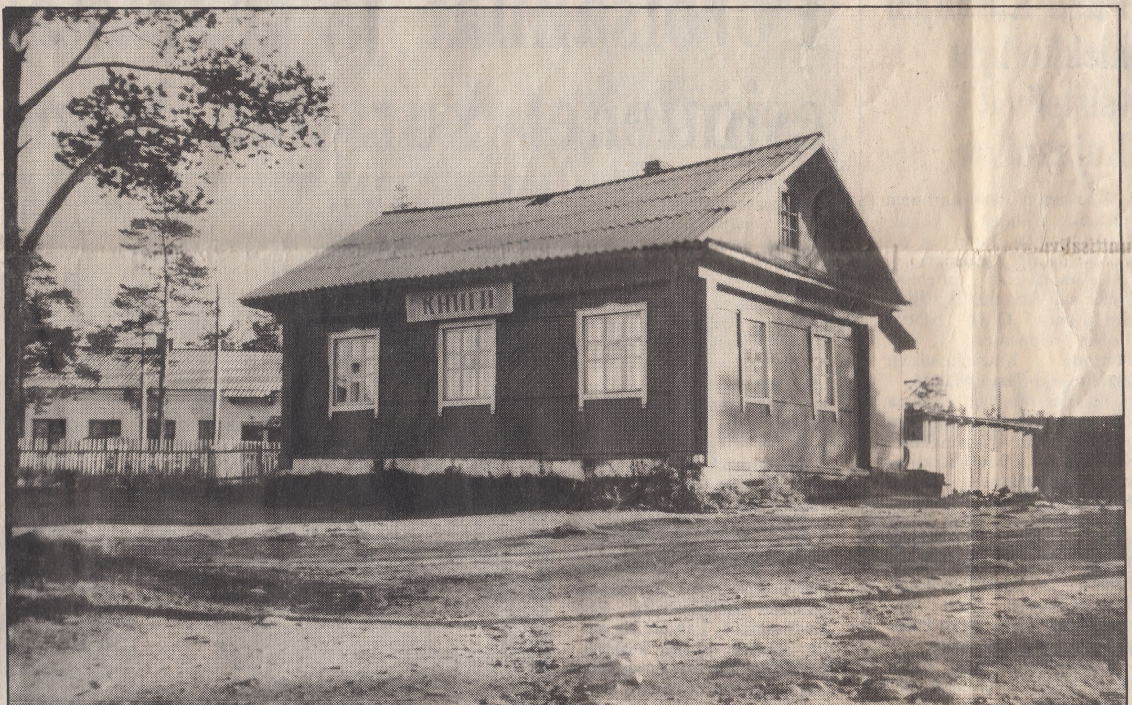
Louhen kaupungin kirjakauppa.

vostoliiton uudesta historiankirjoituksesta, joka nyt on ensimmäistä kertaa alkanut tuoda julkisuuteen asiakirjapohjaista tietoa maan omasta lähihistoriasta. Tästä kiinnostuksesta osoituksena olivat hänen keräämänsä laajat leikekokoelmat, joihin oli koottu aikaisemmin julkaisemattomia tietoja historiasta, yhteen leikekirjaan Stalinista, toiseen uudesta historiankirjoituksesta yleensä.