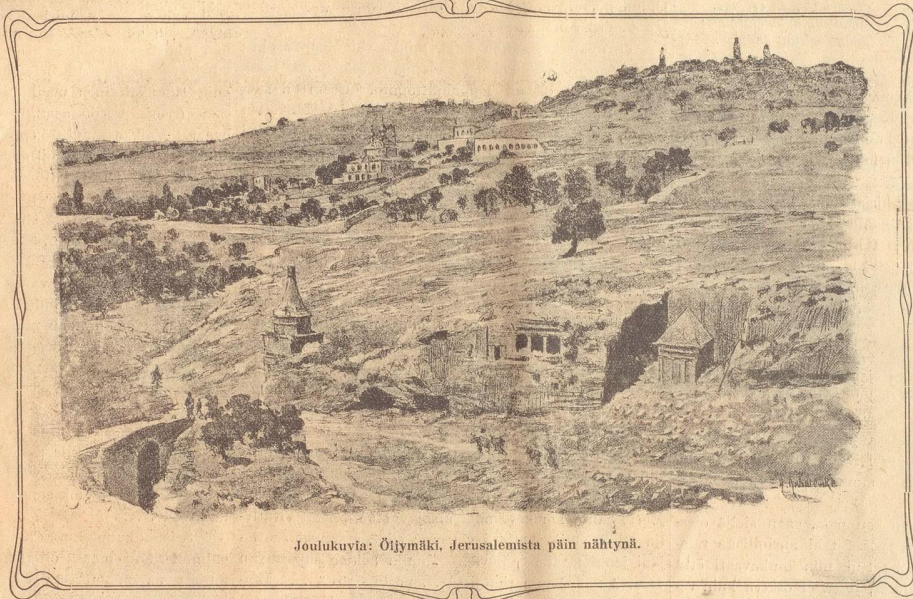
Joulukuvia: Öijymäki, Jerusalemista päin nähtynä.