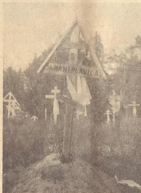
Jamani Puavilan hautakumpu.

Minkä huone korkenevi, sen jo salvos maahan vaipuu, minkä katto umpenevi, sen taas kummulle kohoopi. Ristit nüll' on rinnan päällä, toiset huonehen katolla!