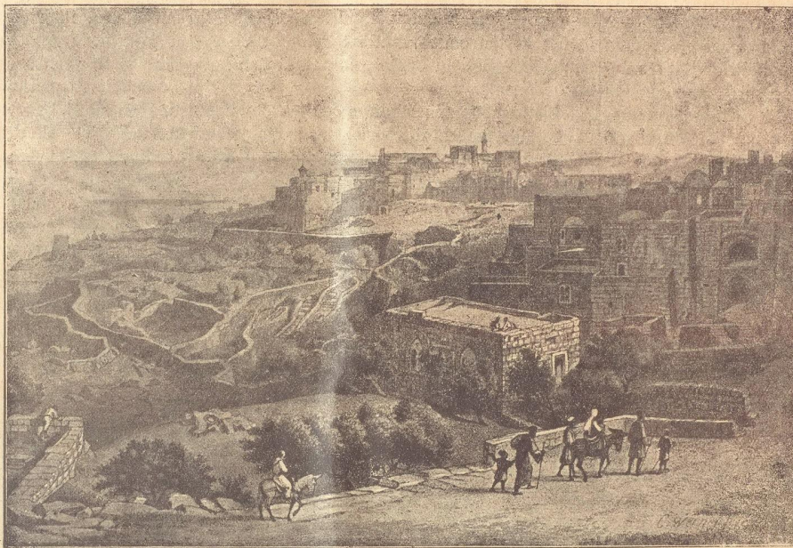
Joulukuuvia: Betteheimin kaupunki.

Kristus Vapahtajamme on tullut maailmaan maallisia hyvyyskokoamaan ja niistä nauttimaan. Aniharvoin tavallinen ihminen syntyy niin kurjissa olosuhteissa, kuin Hän syntyi: karjalola oli hänen syntymisjuonaan, — seimi ensimmäisenä kehtonaan. Maailman silmissä Hän oli köyhän kirvesmiehen poika. Silloin kun Hän toimi meidän pelastukseksenne, ei hänellä ollut mihin päänsä kallistaisi (Luuk. 9: 58). Ei hän etujansa ajanut eikä kunniaa etsinyt eikä palvelusta tahtonut. Hän uhraisi kaikki kokonaan ihmisten hyväksi: — ainoa kunnia, jota hän etsi, oli Jumalan kunnia. Hän sanoi: Minä olen tullut taivaasta tekemään — en omaa tahtona,